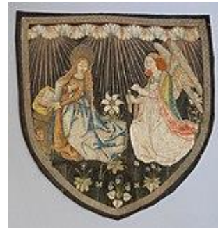
Koorkapschild met annunciatie, 1470 - 1479, Museum Catharijneconvent