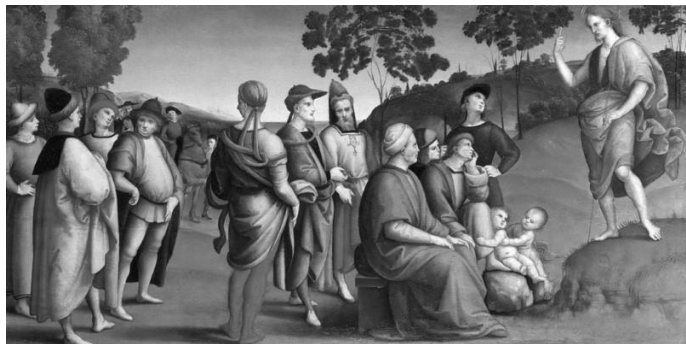
Prediking Joahannes de Doper – Rafaël

Wachten wij daar op? Verwachten wij dat? Dat is de vraag die met het optreden van Johannes de Doper elke keer weer aan ieder mens gesteld wordt. Hij is een grensfiguur, iemand op de rand van oude en nieuw. En de vraag die zijn optreden stelt is: Hoe wordt het begin van het evangelie tot een nieuw begin in ons leven? Hoe vernemen wij de oude woorden uit de Schrift als nieuwe woorden van God voor ons hart?